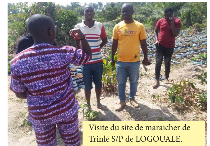
Visite du site de maraicher de Trinlé S/P de LOGOUALE.