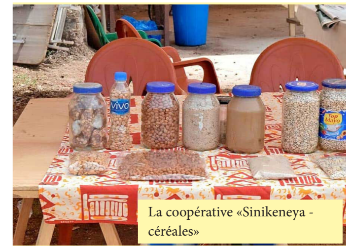
La coopérative «Sinikeneya - céréales»