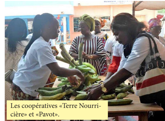
Les coopératives «Terre Nourrière» et «Pavot».