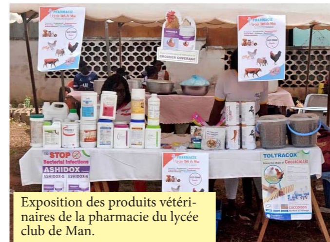
Exposition des produits vétérinaires de la pharmacie du lycée club de Man.