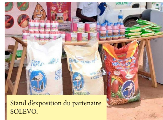
Stand d'exposition du partenaire SOLEVO.

La cérémonie d'ouverture des activités de la SAMAN 2022 s'est tenue le mercredi 23 mars 2022 dans la cours de l'Esplanade du centre Guei Robert en présence des personnalités suivantes :