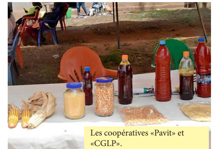
Les coopératives «Pavit» et «CGLP».